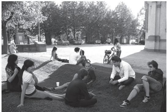
MusikerInnen des Kammermusikwettbewerbs 2011

Tief in der Erinnerung bleiben allen Beteiligten ganz besonders die persönlichen Elemente des Wettbewerbs, etwa als die 1. Preisträger des Wettbewerbs 2017 (das Trio Giselle aus Paris) bei Verkündung der Preisträger erst nach dritter Wiederholung überhaupt glauben konnten, dass sie gewonnen hatten, oder als ein aus Basel anreisender Cellist nicht nur keine Minute Vorbereitungszeit für seinen Auftritt in der 1. Runde, sondern überdies bereits eine mehrstündige Orchesterprobe hinter sich hatte – dass er dennoch 2013 mit seiner Klavierpartnerin den 3. Preis gewann, spricht für seine Professionalität. Viele solcher Geschichten ließen sich erzählen und den Wettbewerb auch für jene lebendig werden, die nicht dabei waren. Dabei erfreut er sich unter der Karlsruher Bevölkerung kontinuierlicher Beliebtheit – nicht nur sind die Preisträgerkonzerte regelmäßig sehr gut besucht, auch bei den Wertungsrunden lauschen fast immer Interessierte teilweise stundenlang den Darbietungen der jungen Musizierenden.