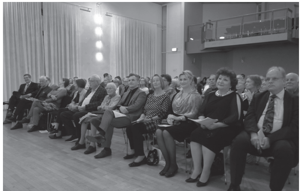
Preisträgerkonzert im Vette-Saal der Musikhochschule Karlsruhe, 2017