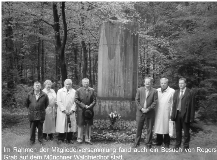
Im Rahmen der Mitgliederversammlung fand auch ein Besuch von Regers Grab auf dem Münchner Waldfriedhof statt.