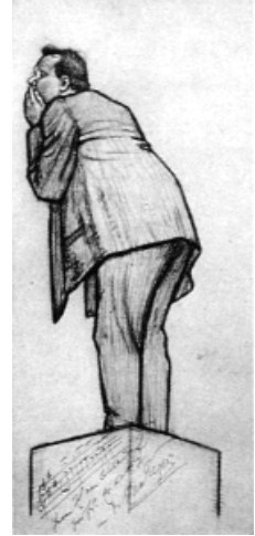
Beckerath-Zeichnung mit Widmung